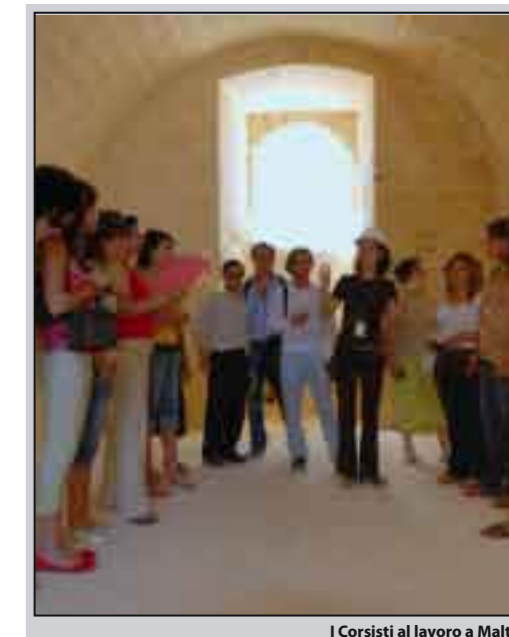
I Corsisti al lavoro a Malta