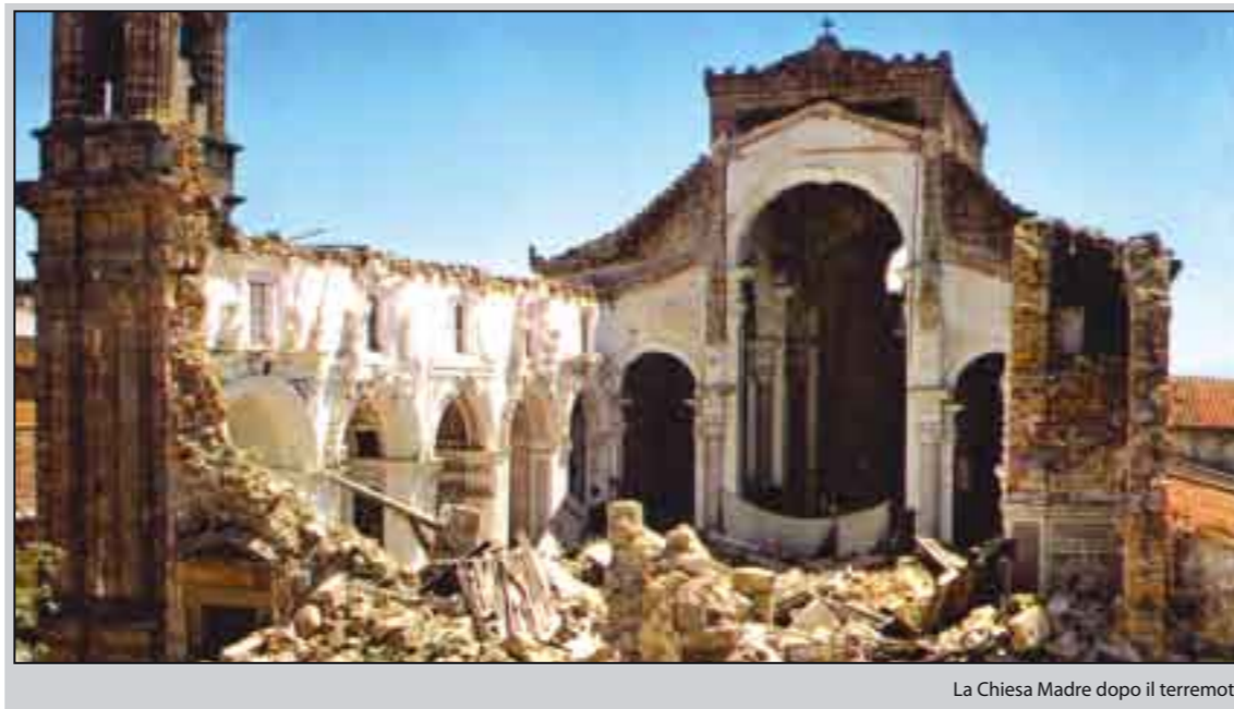
La Chiesa Madre dopo il terremoto