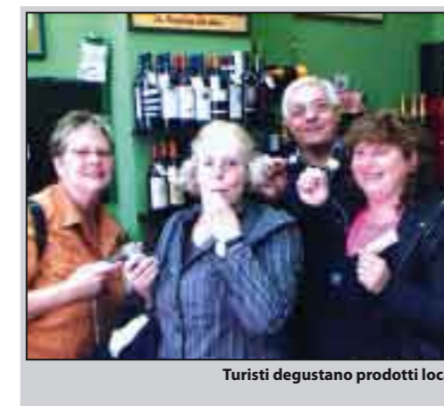
Turisti degustano prodotti locali

D a imprenditore economico debbo dire che l'apertura del Castello Grifeo ha portato a Partanna un flusso di visitatori che hanno contribuito, anche se in modo poco visibile, ad incrementare l'economia. Personalmente, ho creduto da sempre nella fruizione del Castello Grifeo ed ho atteso da nove anni tale apertura; da qualche mese ho pure aperto un secondo punto vendita proprio nelle vicinanze del "Grifeo". Sono venuti tanti visitatori, ma la maggioranza si è limitata solo alla visita del Castello ed è andata subito via, una piccola percentuale ha visitato anche la Chiesa Madre, ma sono veramente pochi coloro che hanno fatto una passeggiata nel centro storico. I più assidui sono stati dei gruppi di tedeschi, accompagnati dalle guide, che oltre a visitare i due monumenti vicini,