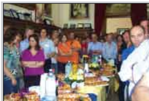
Gli impiegati comunali nel corso della festa del saluto

“Molto degnamente molti miei collaboratori per capacità e competenze avrebbero potuto fare il sindaco, ma io ho ritenuto che Giovanni Cuttone potesse avere i requisiti per essere eletto e sostituirmi degnamente, e i fatti mi hanno dato ragione”. Queste le parole dell'on. Enzo Culicchia nella stanza del sindaco stracolma di impiegati comunali, di assessori e consiglieri comunali venuti alla festa di saluto con il quale l'onorevole ha lasciato la stanza “nella quale ho passato più ore che