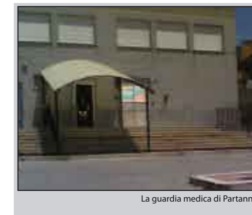
La guardia medica di Partanna

suna Azienda U.S.L. nell'anno 2007. Di conseguenza la Direzione dell'Azienda U.S.L. n° 9 di Trapani ha deciso di attivare per il periodo 1° Luglio/15 Settembre 2008 le seguenti Guardie Mediche Turistiche: San Vito lo Capo, Marausa Lido, Marettimo, Marsala Litorale Sud (presso Tiburon Beach), Mazara Tonnarella, Triscina, Tre Fontane, Alcamo Marina, Scopello, Castellammare del Golfo. Tali Guardie Mediche Turistiche osserveranno orario di apertura diurno (dalle ore 8,00 alle ore 20,00) ad eccezione di quelle di Mazara Tonnarella e Tre Fontane che osserveranno orario continuato 24 ore su 24. La Direzione dell'Azienda U.S.L. n° 9 ha deciso anche la soppressione di n° 4 presidi di Continuità Assistenziale (Guardie Mediche), sempre