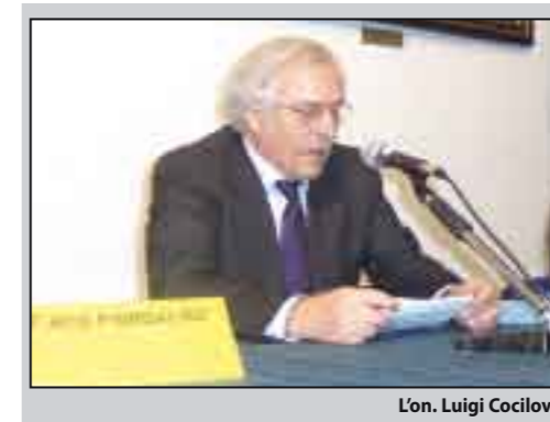
L'on. Luigi Cocilovo