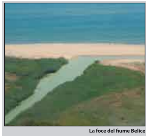
La foce del fiume Belice

Nell'esaminare le vicende demografiche della "Valle del Belice", limitiamo l'indagine a quella parte di territorio della provincia di Trapani, tributario del Belice, che si stende ad ovest del fiume, dal Mare di Selinunte fino alla confluenza dei due bracci da cui