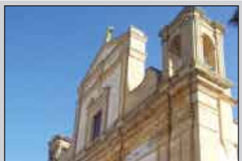
La Chiesa Madre com'è ora

l'orologio, ogni giorno ne curava la ricarica e, all'occorrenza, provvedeva a eventuali riparazioni o a "messa a punto" del complesso meccanismo. Lo stesso lavoro svolgeva anche per l'altro orologio da torre situato sul campanile della chiesa di S. Francesco, da cui partiva la sera l'ultimo "tocco" che, a battiti lenti ma soavemente penetranti, percettibili ovunque per l'assenza di rumori serali, irradiava l'invito al ritiro in casa e al riposo notturno. Più ancora penetrante era l'alternarsi di battiti delle due campane (la grande delle ore e la piccola dei minuti) come "annuncio" del mezzogiorno e della mezzanotte nel silenzio assoluto della notte. "Tin-tan", "tin-tan", ripetevano i sacri bronzi con un brevissimo intervallo di un minuto secondo per la durata di circa 5 minuti primi. Poi seguiva il normale battito delle ore. Oggi l'orologio da torre, dove esiste o dove è stato lodevolmente riattivato (come quello del campanile di S. Francesco in Partanna) non esercita più il ruolo trainante di