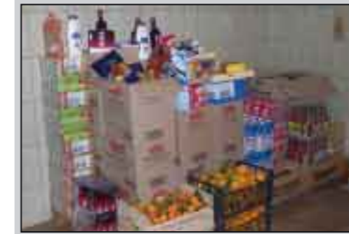
Prodotti alimentari pronti per essere donati