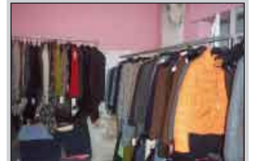
Capi di vestiario pronti per essere donati