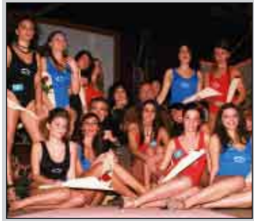
Le concorrenti