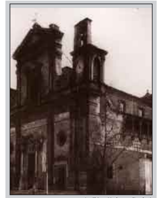
La Chiesa Madre con l'orologio