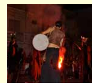
Gli artisti di strada con i trampoli hanno preceduto con le loro esibizioni i giochi di artificio.