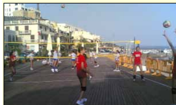
Partita sulla terrazza per far dimenticare lo spazio tolto (con la costruzione della terrazza) al volley sulla spiaggia che prima si praticava con grande seguito di giovani.