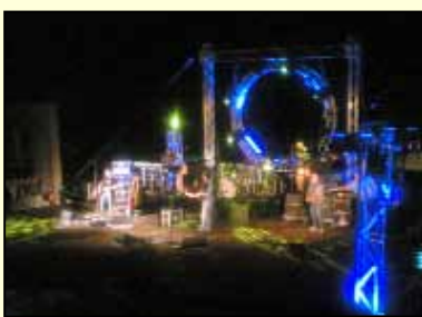
Un momento del concerto dei Nomadi

I concerti della cantante Noemi (in piazza Falcone e Borsellino il 12 agosto, alle 23,30) e quello del cantautore Edoardo Bennato (allo stesso posto alle 23,30 il 20 agosto) sono state le manifestazioni gratuite di richiamo che hanno fatto da traino alla buona riuscita delle notti bianche che hanno accompagnato i due concerti e nelle quali ci sono state degustazioni gratuite di prodotti tipici organizzate in collaborazione con i commercianti partanesi e il pescato siciliano nell'ambito del progetto "Terramare". Il programma denominato Artemusicultura 2010, IV Rassegna culturale "Castello Grifeo" ha presentato spettacoli offerti dall'assessorato regionale al turismo nell'ambito del "Circuito del mito" (38 paesi in Sicilia) in cui è stata inserita pure la città di Partanna. Le manifestazioni in programma (delle quali pochissime sono state a pagamento) hanno avuto inizio l'1 agosto e si sono concluse l'11 settembre. Fra gli eventi più significativi, oltre ai due concerti in piazza, le esibizioni di Peter