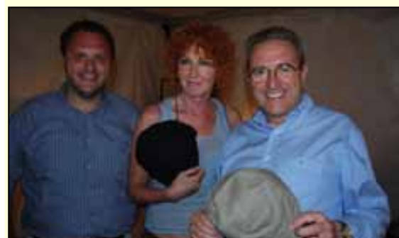
Di fortissimo richiamo lo spettacolo musicale di Fiorella Mannoia (al centro nella foto)