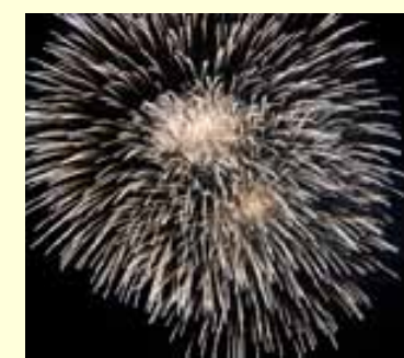
Le quattro giornate di giochi di artificio sono state caratterizzate dalla presenza di tanta gente.