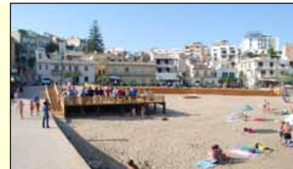
La terrazza realizzata in legno in piazza Empedocle, bella e utile, è destinata a durare pochissimo: numerosi sono già i buchi a poco più di un mese dalla sua inaugurazione.