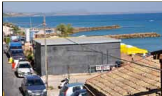
In primo piano la struttura che è sorta come un fungo in piena Piazza Efebo. E' stata positiva l'esigenza di creare movimento con un punto di ristoro, ma la costruzione è proprio un pugno in un occhio!

puntato di più l'amministrazione del sindaco Gianni Pompeo sono state però certamente quelle connesse alla festa del fuoco, non solo con quattro giornate differenti (nelle quattro domeniche del mese di agosto) di giochi di artificio di livello, ma anche con iniziative collaterali come ad esempio lo spettacolo per le vie della borgata da parte degli artisti di strada sui trampoli. Lodevole, dunque, il tentativo di quest'anno (più tangibile) da parte dell'amministrazione di muoversi in tutte quelle direzioni di cui si è detto, per evitare che Marinella di Selinunte d'estate si configurasse come una zona di soggiorno per anziani che vogliono solo riposare, ma qualche cosa si poteva pure evitare: ad esempio, la realizzazione di una struttura - in piena piazza! - che è, anche per le caratteristiche estetiche della costruzione, un pugno in un occhio (e oggetto di grande indignazione da parte di tanti) nella centrale piazza Efebo (vedi prima foto da sinistra); altra notazione va fatta sulla realizzazione della terrazza della zona del porticciolo, di per sé utile e bella, ma in legno, e destinata, dunque, a durare pochissimo nel tempo (già a poco più di un mese dalla sua inaugurazione i buchi sono tanti) alla faccia dei, non vorremmo sbagliare, duecentomila euro spesi per realizzarla.