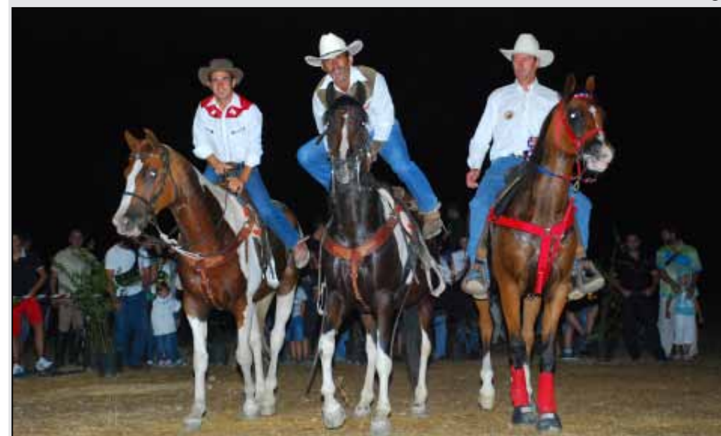
Show di cavalieri e cavalli