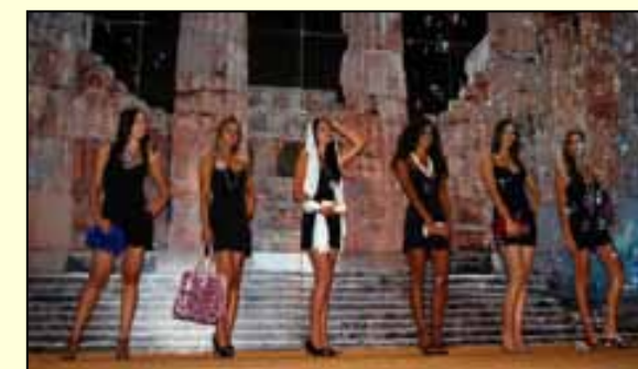
Di forte richiamo la sfilata di moda organizzata a Piazza Empedocle dall'Associazione artistica "Il Sipario" di Partanna.