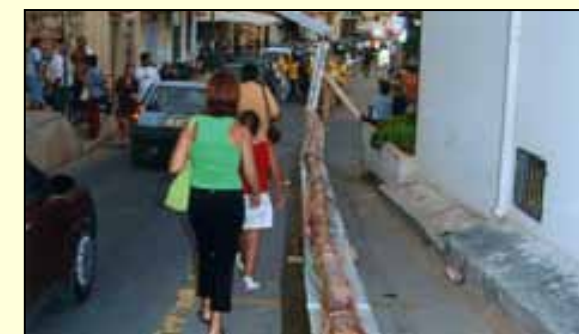
Ancora non si è potuto realizzare il "pani cunzatu" più lungo del mondo.