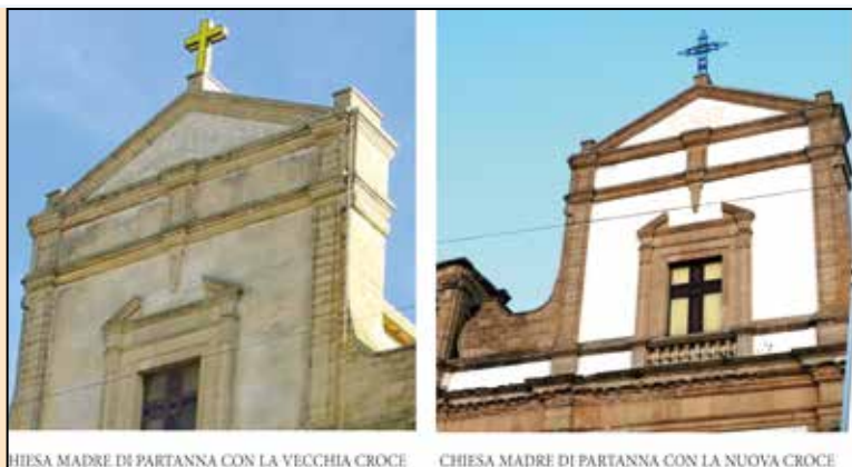
CHIESA MADRE DI PARTANNA CON LA VECCHIA CROCE | CHIESA MADRE DI PARTANNA CON LA NUOVA CROCE

ferma nella ricerca di un riferimento orante, sembrano posarsi come rapiti dall’imponente bellezza della croce. Finalmente a circa quattro anni dalla rimozione della precedente croce luminosa in plexiglass giallo, che mal si addiceva all’armonica bellezza della facciata artistica, la Matrice torna ad essere “completa”. Già dal 2017 si era infatti provveduto alla